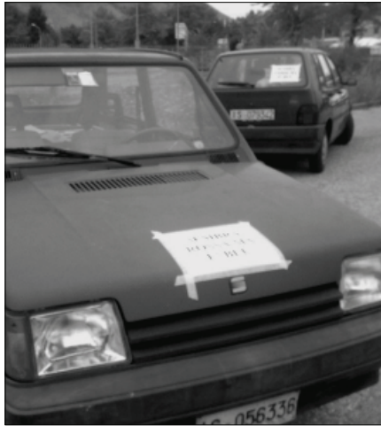
I cartelli affissi sulle auto